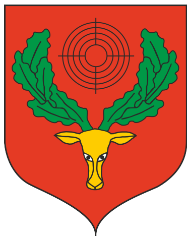
Oficjalny Herb Pionek